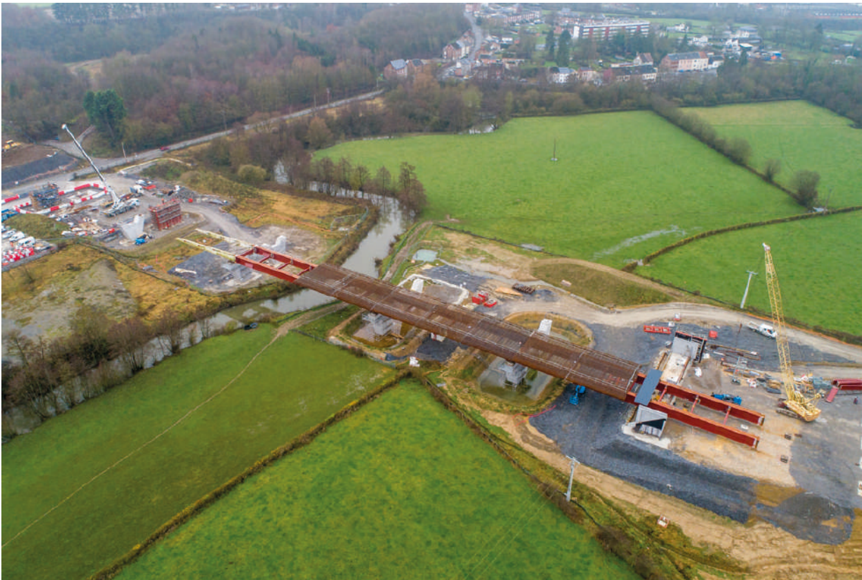
RN2 - Viaduc de franchissement de l'Helpe Majeure