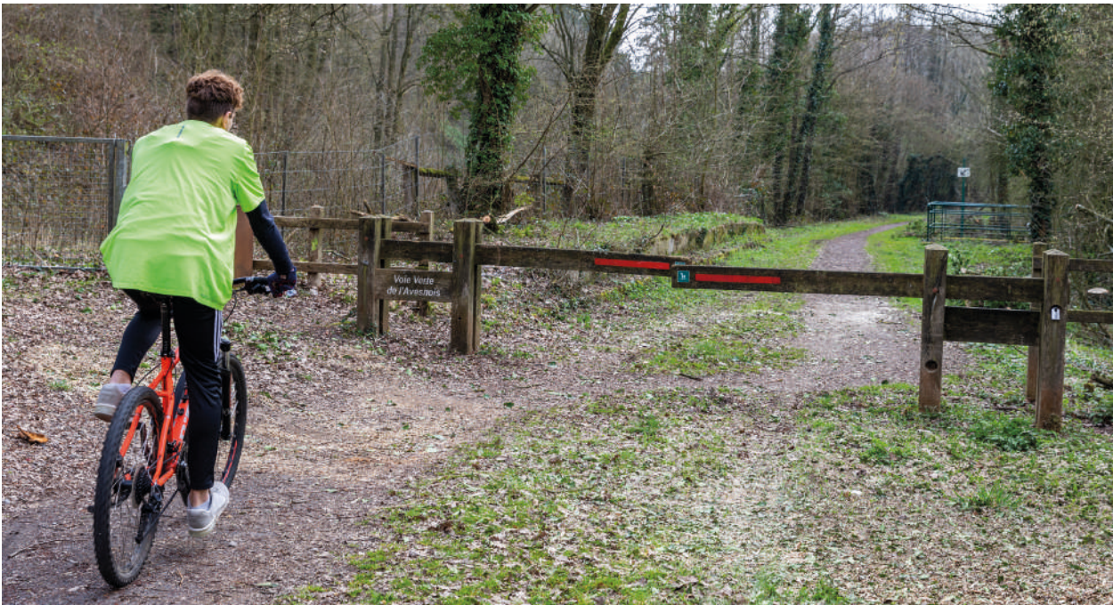
Voie verte de l'Avesnois