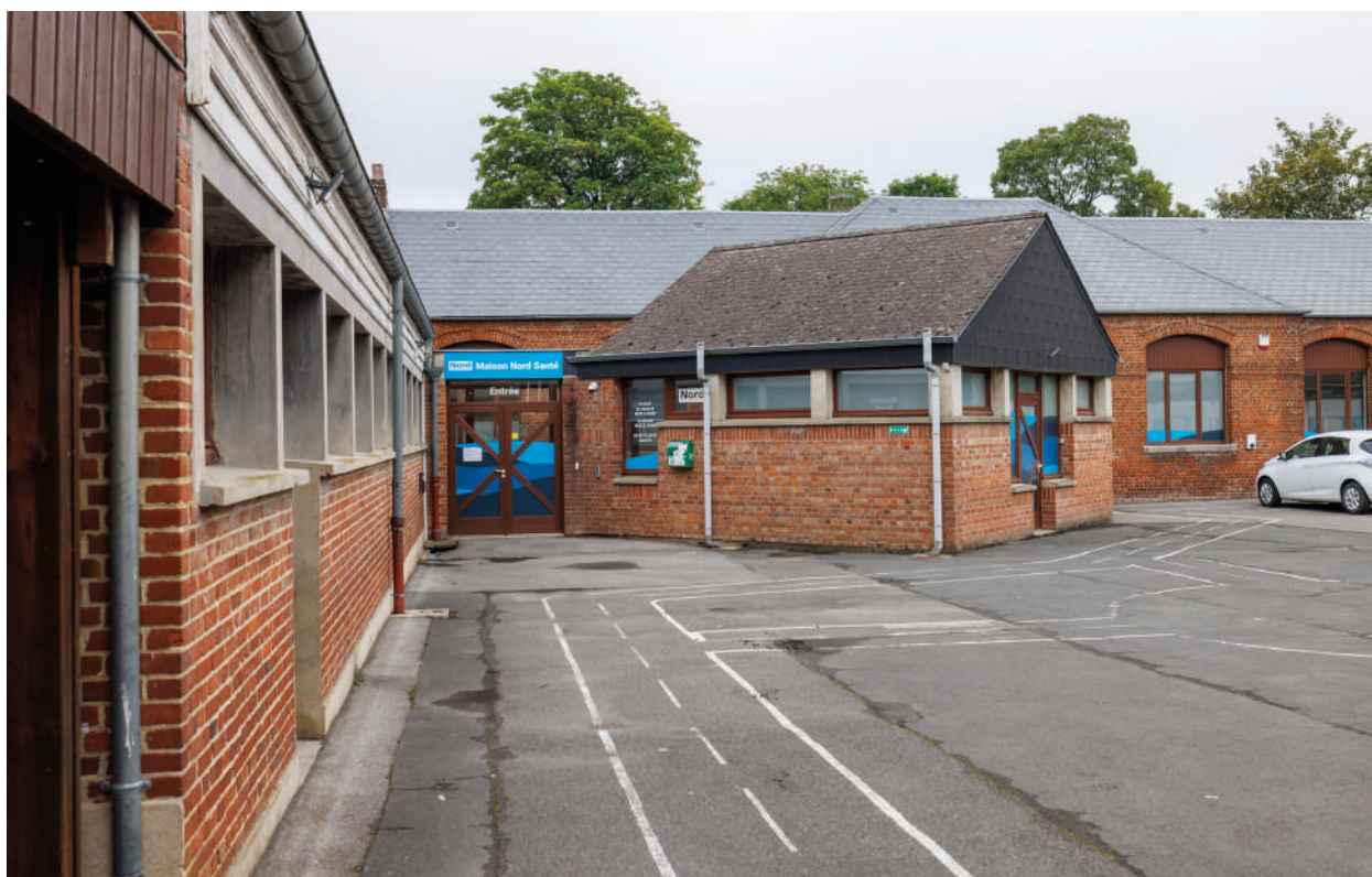
Maison Nord Santé de Glageon

Il s'agit également de faire en sorte que les supports de communication sur les réalisations du Pacte SAT 3 (panneaux, bâches de chantier...) revêtent systématiquement le logo du Pacte et mentionnent l'engagement des financeurs et que les décisions ou arrêtés d'attribution de financement utilisent invariablement ce même logo.