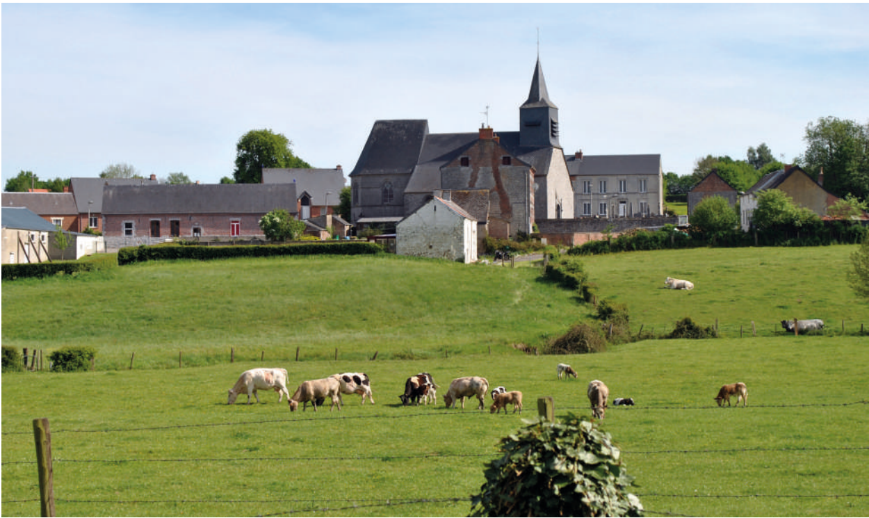
Village de Lez-Fontaine