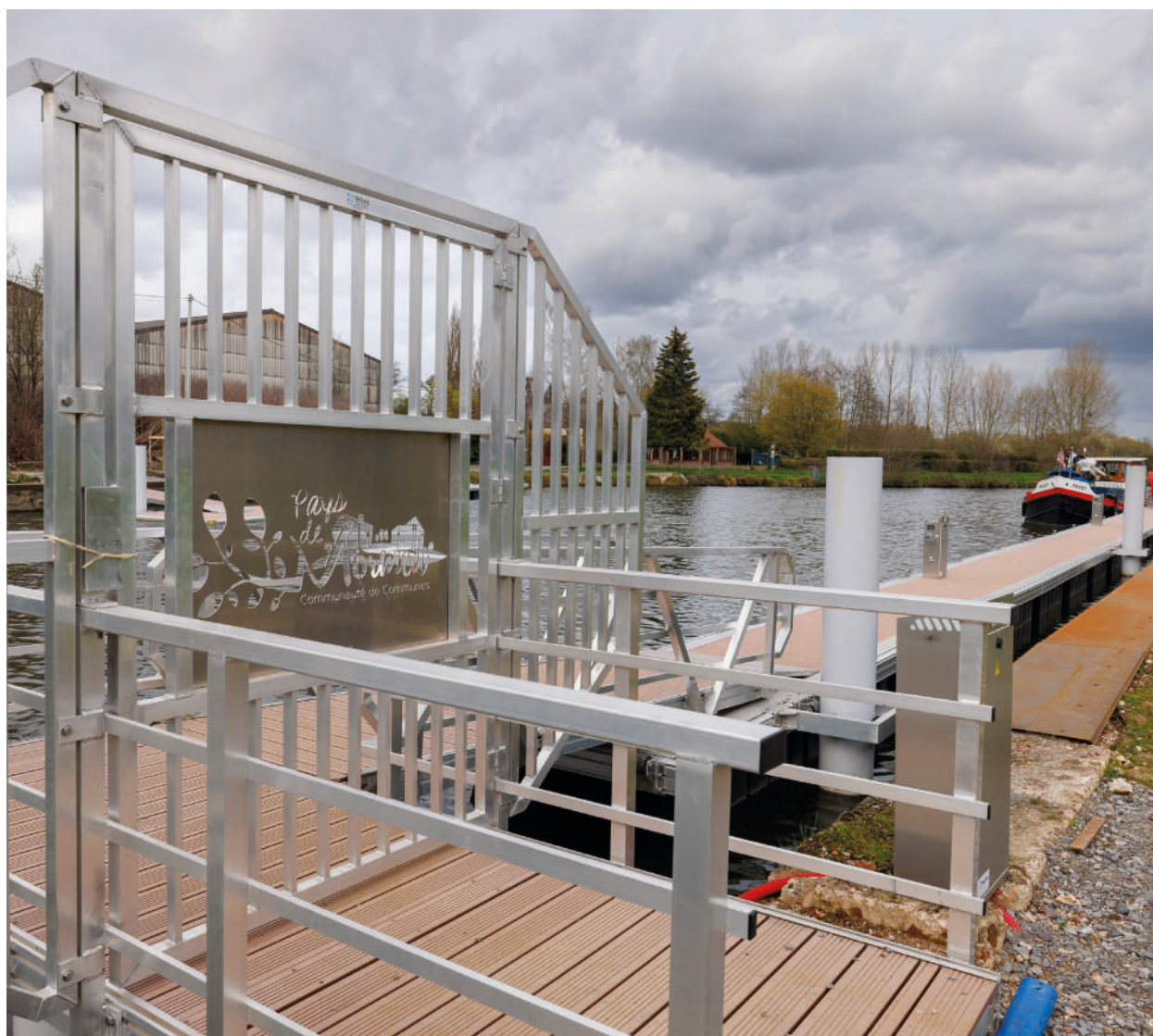
Halte nautique de Landrecies

Il s'agirait également de conforter les écoles de production sur le territoire ainsi que l'appareil de formation en apprentissage, notamment les centres de formation d'apprentis.