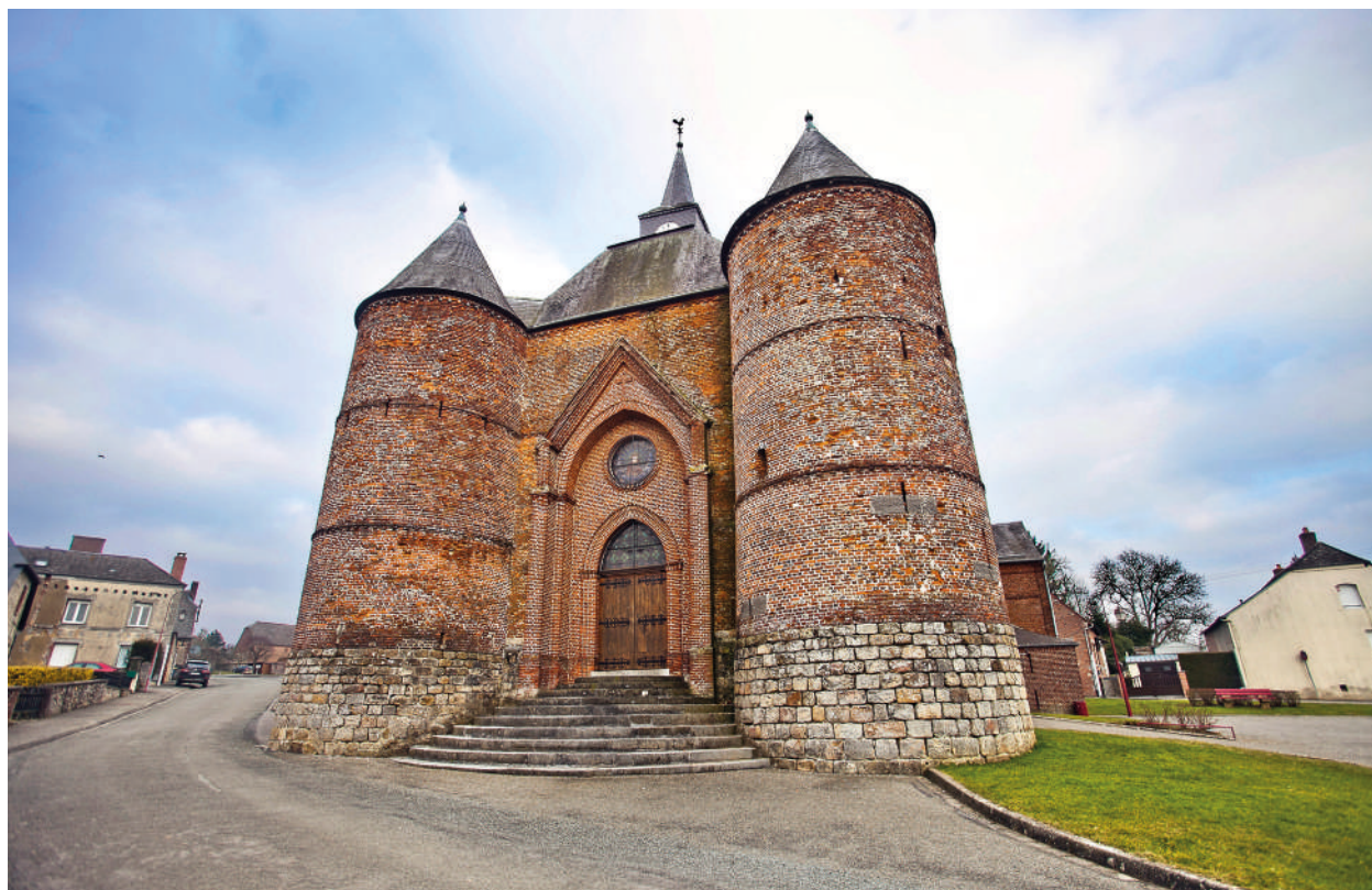
Église de Wimpy