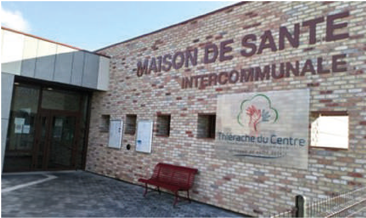
Maison de santé de La Capelle