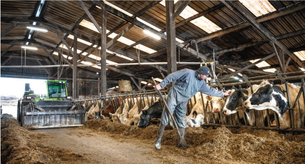
Gilles Druet, éleveur de Bleues du Nord, La Ferme de Saint-Aubin