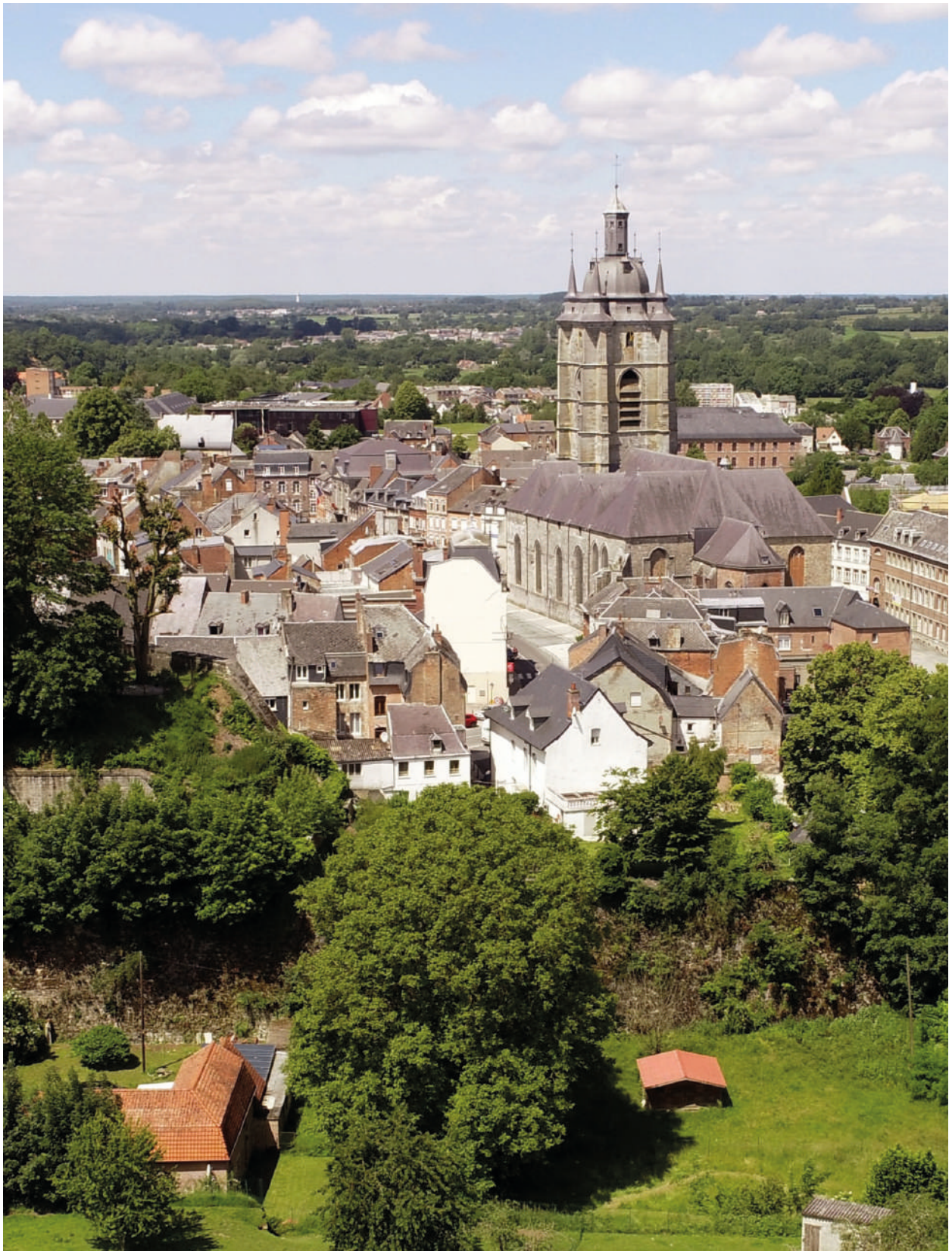
La collégiale Saint-Nicolas d'Avesnes-sur-Helpe