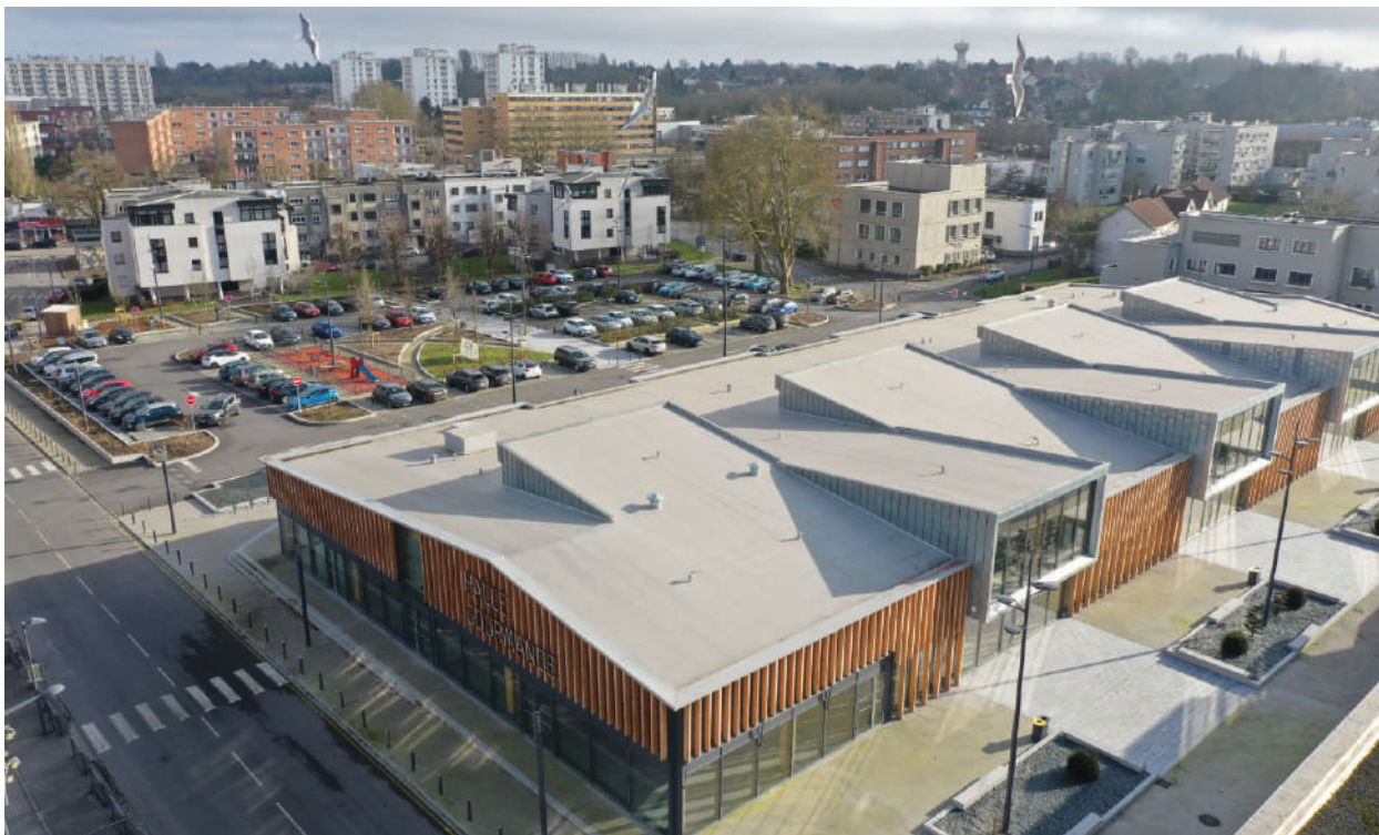
La Halle Gourmande de Maubeuge - © Préfecture du Nord