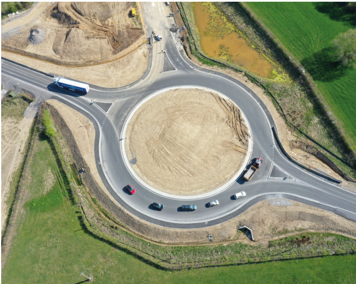
RN 2 - Échangeur d'Avesnelles