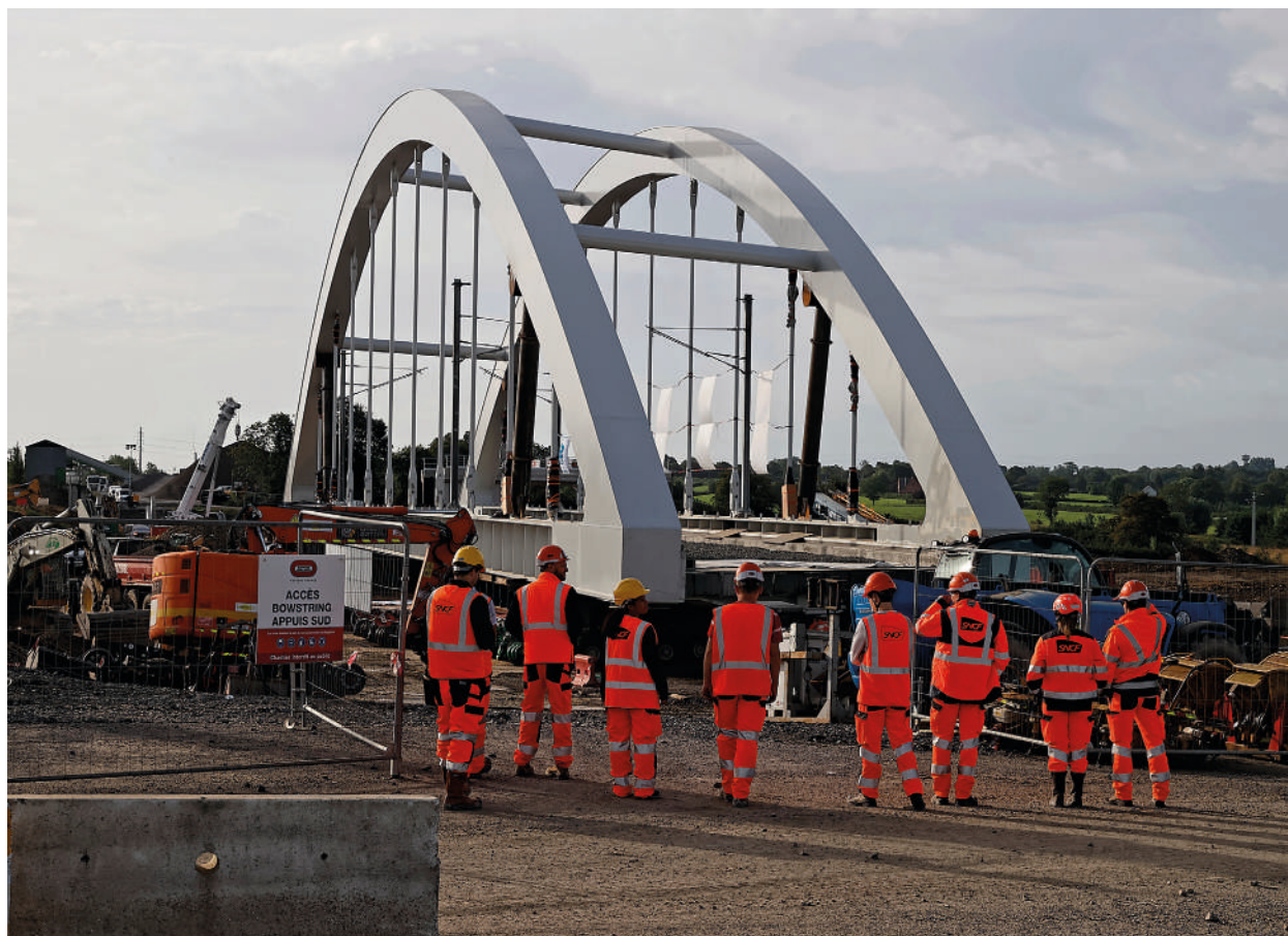
Pont ferroviaire d'Avesnelles

Il s'agit de poursuivre l'accompagnement des publics fragiles et leur accès à la mobilité, notamment grâce aux plateformes de mobilité solidaires, telle que celle portée par la mission locale de Thiérache.