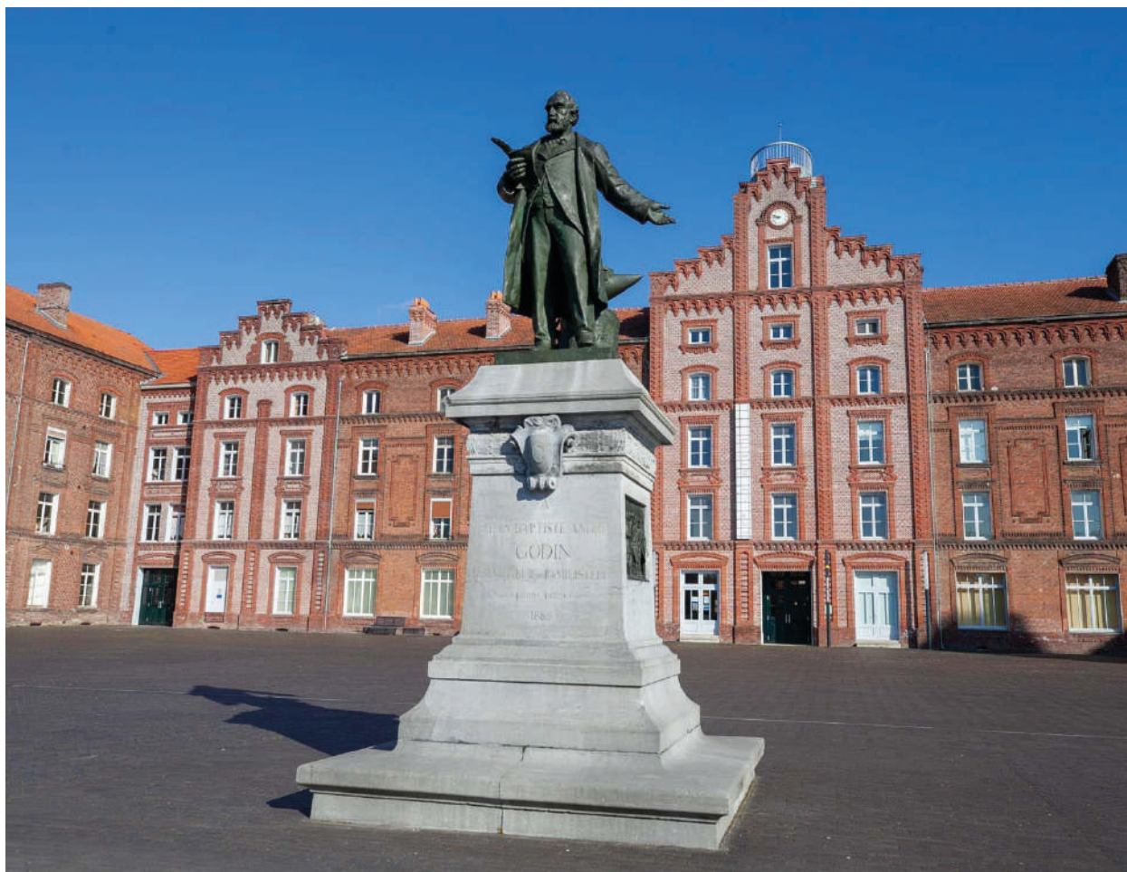
Familistère de Guise

La mise en lumière des richesses patrimoniales de ces territoires et leur mise en réseau en s'appuyant sur les équipements présents, permet également d'en renforcer son attractivité touristique.