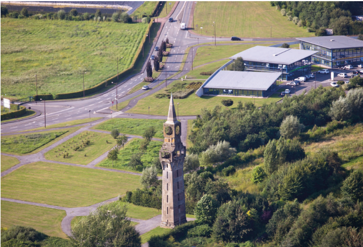
La Tour Florentine à Hirson