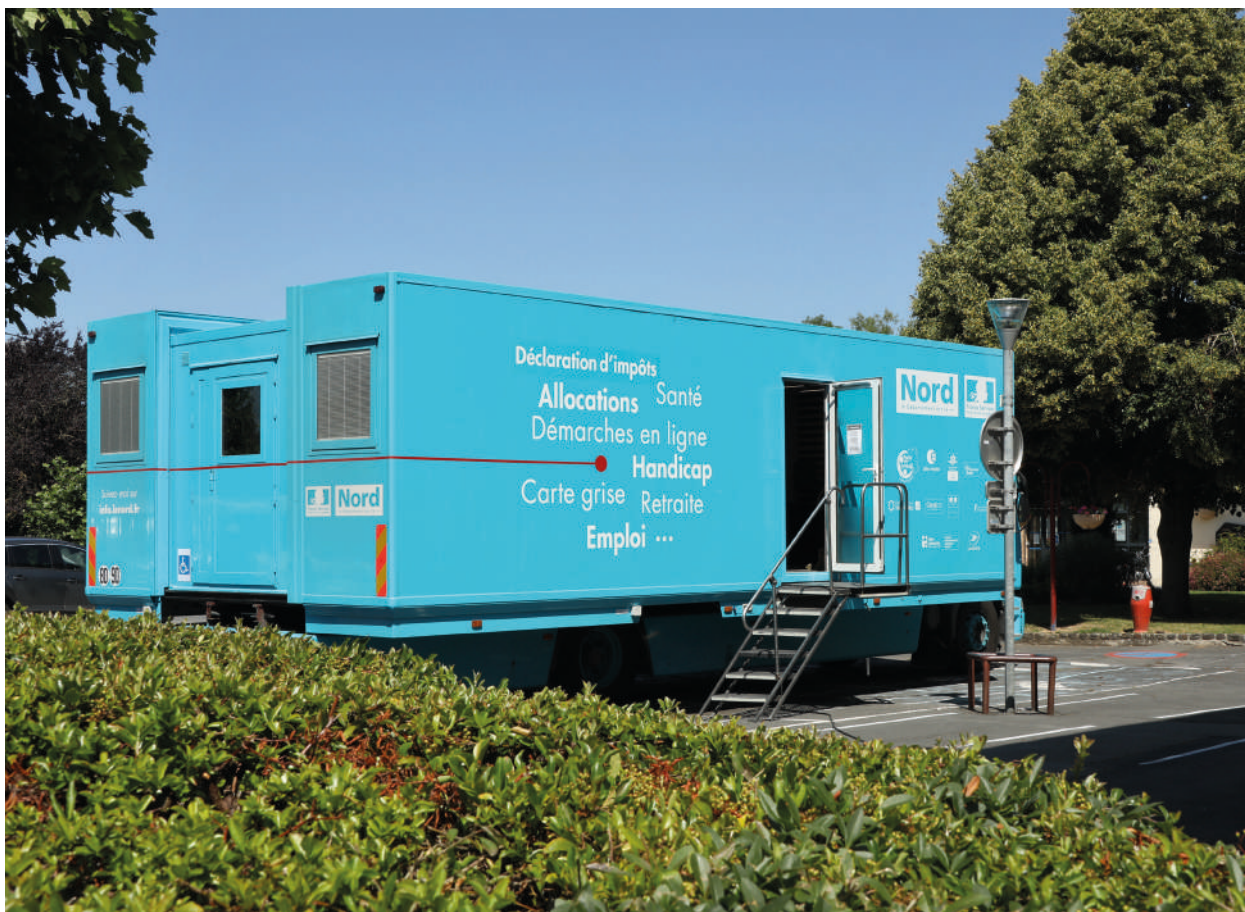
Camion bleu France services de l'Avesnois

Sur le volet santé, la SAT se caractérise par des indicateurs encore trop dégradés. L'espérance de vie à la naissance est inférieure de 3,7 ans à la moyenne nationale pour les hommes et de 2,8 ans pour les femmes. Cela révèle que les comportements à risque pour la santé (tabac, alcool, nutrition, sédentarité) sont ancrés. Ils expliquent une prévalence très élevée de certaines pathologies (cancer, maladies cardiovasculaires, diabète, obésité). La situation est également spécifique sur le plan du handicap puisque les bénéficiaires de l'allocation adulte handicapé (AAH) sont 60 % plus nombreux que la moyenne nationale. Si la densité des professionnels de la santé reste plus faible qu'en région et qu'au niveau national, l'un des objectifs principaux du nouveau contrat est bien de déployer des actions permettant l'installation et le maintien de médecins sur le territoire.