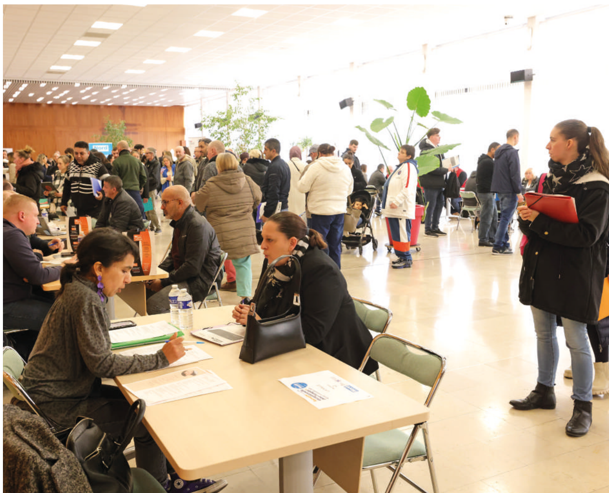
Semaine « Réussis sans attendre » à Maubeuge

Au-delà de supporter l'implantation de nouvelles industries, l'objectif pour la SAT est d'accompagner davantage celles déjà installées sur le territoire, en apportant de l'ingénierie de projet renforcée aux intercommunalités et aux entreprises pour pérenniser le tissu existant.