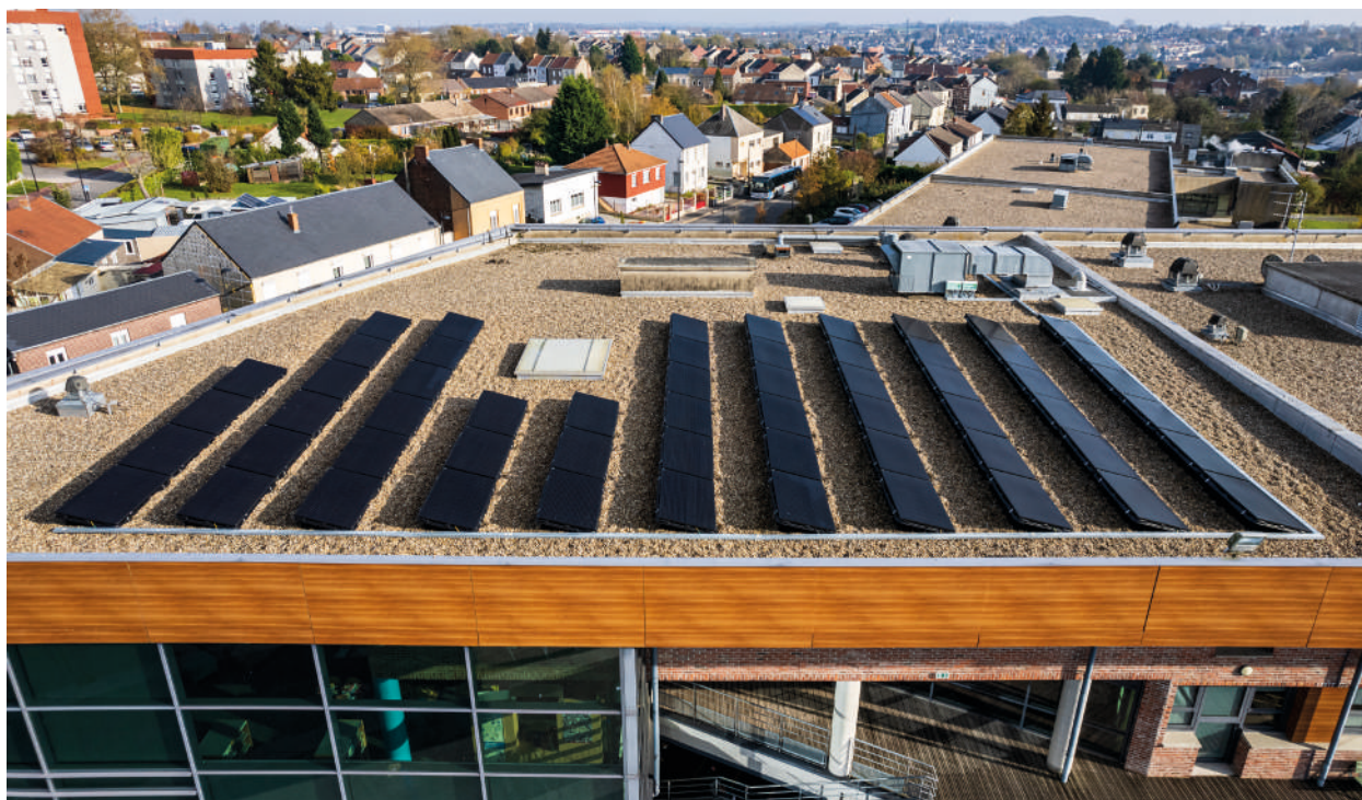
Rénovation énergétique du collège Pierre Ronsard à Haumont