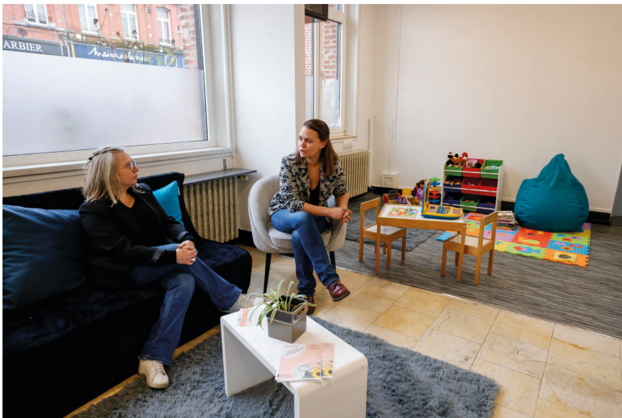
Accueil de jour Aubépine à Fourmies