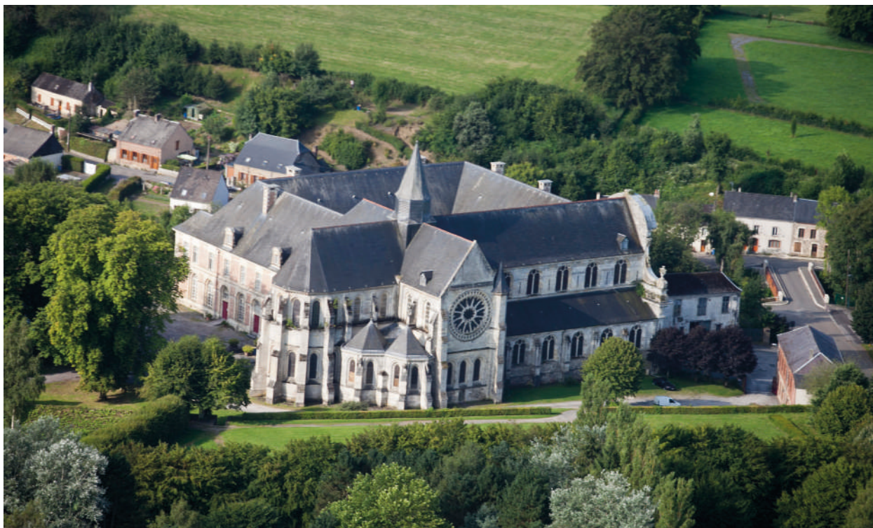
Abbaye Saint-Michel en Thiérache

Une attention particulière sera portée à la façon de fédérer les acteurs culturels et patrimoniaux à travers la mise en réseau ou la professionnalisation de certains opérateurs (musées, micro-folies etc.) mais également en s'appuyant sur les équipements et opérateurs « phares » du territoire tels que l'abbaye de Saint-Michel, le Familistère de Guise, le Pôle des cultures actuelles d'Aulnoye-Aymeries, le Pôle gare numérique de Jeumont, l'Ecomusée de l'Avesnois et ses sites de Trélon et Fourmies, le Manège-scène scène nationale de Maubeuge, la saison culturelle transfrontalière d'Hirson, etc.