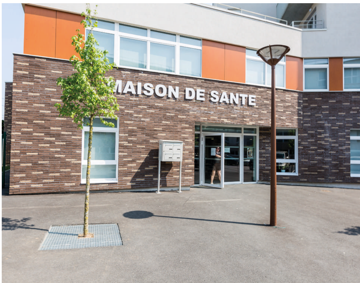
Maison de santé pluri-professionnelle d’Aulnoye-Aymeries

La totalité de la SAT est désormais éligible aux aides à l’installation pour les médecins libéraux (100 % du territoire qualifié en zone d’intervention prioritaire). Cela s’accompagne d’efforts des collectivités territoriales en faveur du financement des locaux professionnels, du logement pour les internes et de la mise en valeur des atouts des communes auprès des universités. La coordination des actions entre l’État, les CPAM de l’Aisne et du Hainaut et les collectivités territoriales sera renforcée.